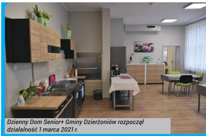
Dzienny Dom Senior+ Gminy Dzierżoniów rozpoczął działalność 1 marca 2021 r.