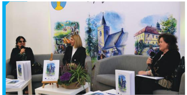
30 września w zabytkowym pałacu w Kielczyńcu odbyło się spotkanie z twórcami „Legend i opowieści z gminy Dzierżonów”