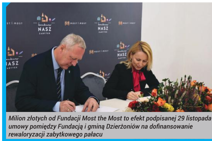
Milion złotych od Fundacji Most the Most to efekt podpisanej 29 listopada umowy pomiędzy Fundacją i gminą Dzierżoniów na dofinansowanie rewitalizacji zabytkowego pałacu