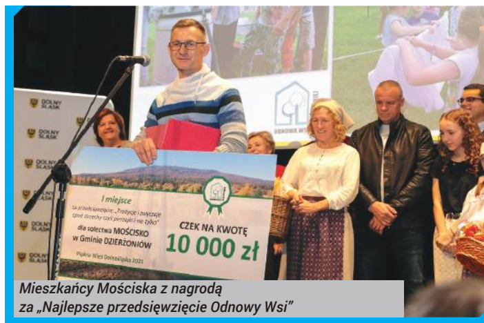
Mieszkańcy Mościska z nagrodą za „Najlepsze przedsięwzięcie Odnowy Wsi”

cznie i Włókach, przeprowadzono na długości 4132 mb. Wartość zadania to prawie 65 tys. zł, przy czym nasza gmina otrzymała pomoc finansową z budżetu województwa dolnośląskiego w wysokości 31,5 tys. zł.