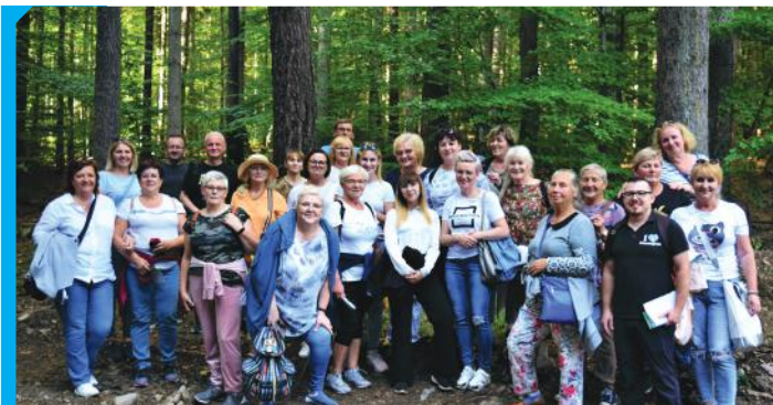
W ramach projektu „Między Ślężą a Sową” nasi mieszkańcy wraz z przedstawicielami gminy Pieszyce wybrali się na wycieczkę w Góry Sowie

Dziękujemy wszystkim, którzy wspólnie z nami działali na rzecz rozwoju gminy Dzierżonów!