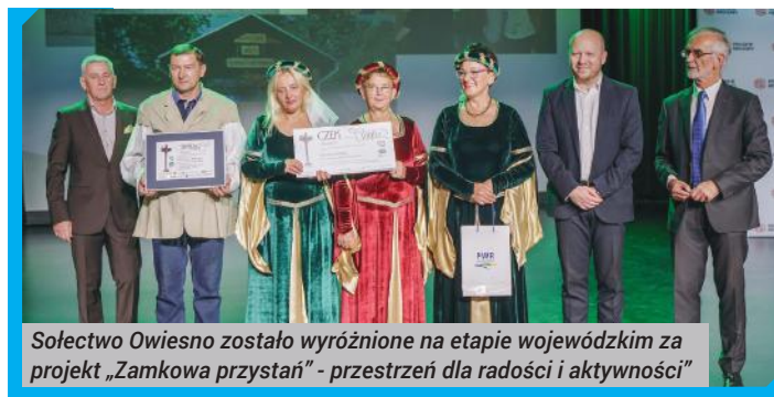
Sołectwo Owiesno zostało wyróżnione na etapie wojewódzkim za projekt „Zamkowa przystań” - przestrzeń dla radości i aktywności”

• I miejsce: sołectwo Karski, gmina Ostrów Wielkopolski w woj. wielkopolskim za przedsięwzięcie: „Wiśniowy