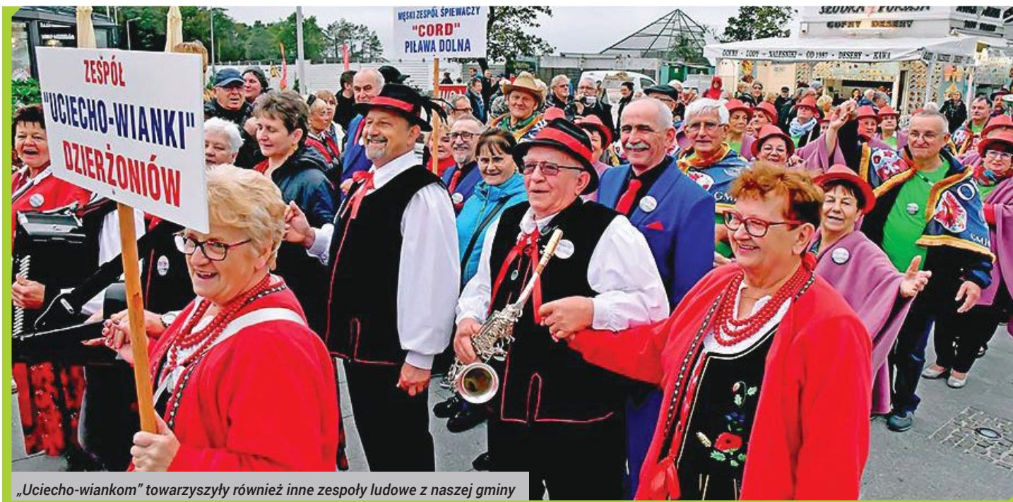
„Uciecho-wiankom” towarzyszyły również inne zespoły ludowe z naszej gminy