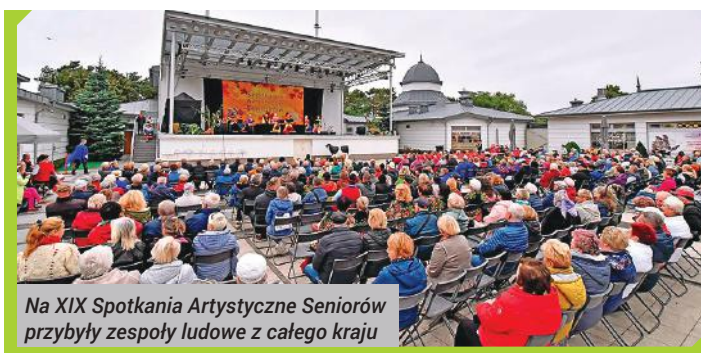
Na XIX Spotkania Artystyczne Seniorów przybyły zespoły ludowe z całego kraju