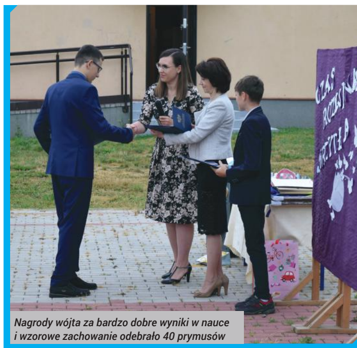
Nagrody wójta za bardzo dobre wyniki w nauce i wzorowe zachowanie odebrało 40 prymusów

Serdecznie gratulujemy nie tylko nagrodzonym uczniom, ale także ich rodzicom, opiekunom i nauczycielom.