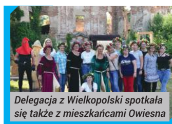
Delegacja z Wielkopolski spotkała się także z mieszkańcami Owiesna

Następnie mieszkańcy Krobia przenieśli się do Owiesna, gdzie poznali ofertę „Wsi Okrągłego Zamku”. Nasi goście pod