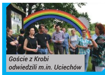
Goście z Krobia odwiedzili m.in. Uciechów