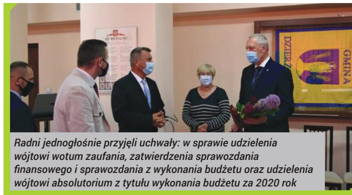
Radni jednogłośnie przyjęli uchwały: w sprawie udzielenia wójtowi wotum zaufania, zatwierdzenia sprawozdania finansowego i sprawozdania z wykonania budżetu oraz udzielenia wójtowi absolutorium z tytułu wykonania budżetu za 2020 rok

W głosowaniach radni jednogłośnie przyjęli uchwały: w sprawie udzielenia wójtowi wotum zaufania, zatwierdzenia sprawozdania finansowego i sprawozdania z wykonania budżetu oraz udzielenia