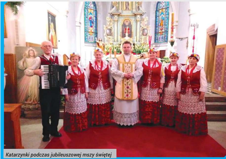
Katarzynki podczas jubileuszowej mszy świętej

Wspólne śpiewanie daje im wiele radości, a dobry kontakt z publicznością gwarantuje wyjątkowość każdego spotkania z „Katarzynkami”. Muzyka to ich pasja, dlatego dzielenie się nią sprawia zespołowi ogromną przyjemność.