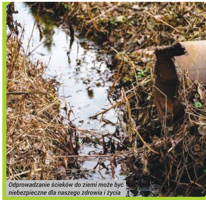
Odprowadzanie ścieków do ziemi może być niebezpieczne dla naszego zdrowia i życia

nieczystości ciekłe (szamba) lub przydomowej oczyszczalni ścieków bytowych ma obowiązek posiadania umowy na wywóz nieczystości ciekłych lub