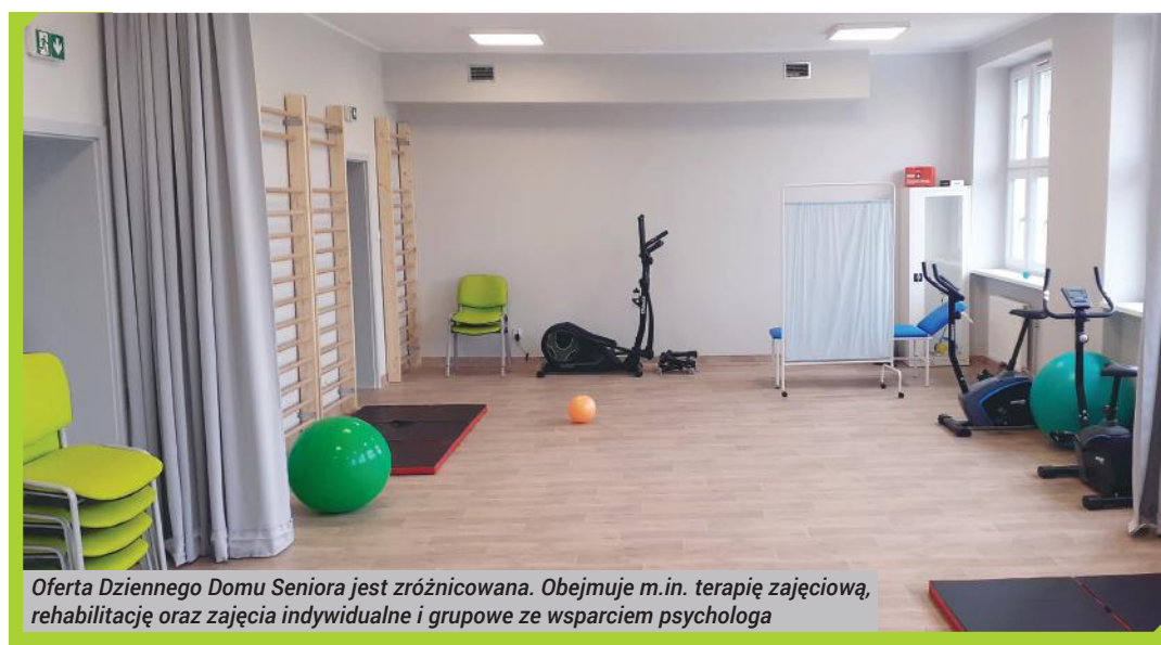
Oferta Dziennego Domu Seniora jest zróżnicowana. Obejmuje m.in. terapię zajęciową, rehabilitację oraz zajęcia indywidualne i grupowe ze wsparciem psychologa