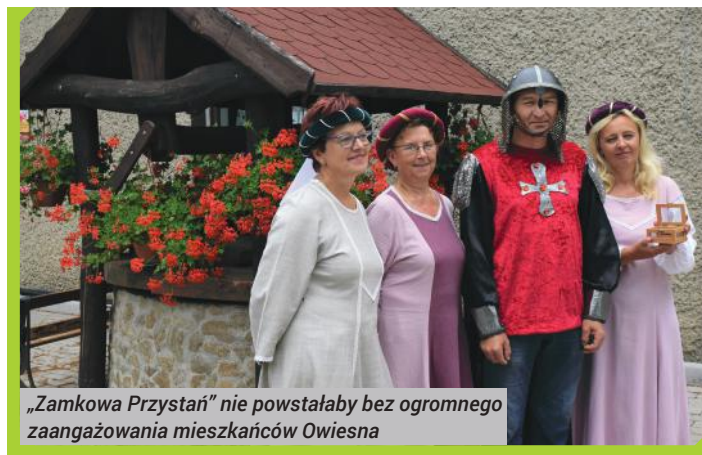
„Zamkowa Przystań” nie powstałaby bez ogromnego zaangażowania mieszkańców Owiesna

„Zamkowa Przystań” w Owieśnie to niezwykle miejsce, które jest sercem „Wsi Okrągłego Zamku”. Powstało przy ogromnym zaangażowaniu mieszkańców wsi. Jeszcze kilka lat temu znajdowało się tam stare, zrujnowane miejsce skupu mleka, nieużywana i zaniedbana remiza strażacka i zarośnięty park z kilkoma ławkami. Teraz to zupełnie inna przestrzeń, która jest dumą miejscowości i