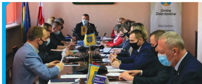
Radni zdecydowali o przyznaniu środków na działalność leczniczą związaną z pandemią COVID-19 dla Szpitala Powiatowego w Dzierżoniowie

Radni zdecydowali również o przyznaniu dotacji w wysokości 55 tys. zł dla Szpitala Powiatowego w Dzierżoniowie. Środki te zostaną przeznaczone na działalność leczniczą związaną z pandemią COVID-19. To kolejna pomoc udzielona dzierżoniowskiemu szpitalowi z budżetu gminy Dzierżoniów.