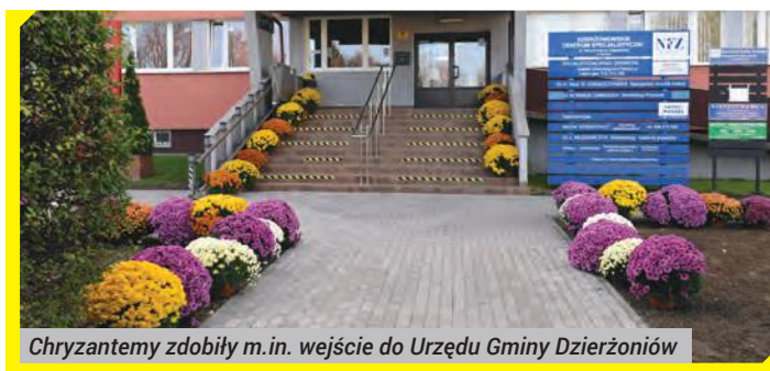
Chryzantemy zdobiły m.in. wejście do Urzędu Gminy Dzierżoniów

tem, którzy ponieśli straty na skutek wprowadzonego zakazu wstępu na cmentarze.