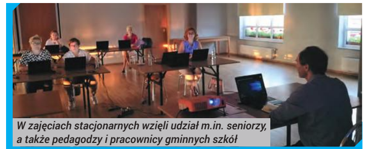
W zajęciach stacjonarnych wzięli udział m.in. seniorzy, a także pedagodzy i pracownicy gminnych szkół