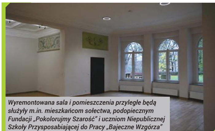
Wyremontowana sala i pomieszczenia przyległe będą służyły m.in. mieszkańcom sołectwa, podopiecznym Fundacji „Pokolorujmy Szarość” i uczniom Niepublicznej Szkoły Przystosobiającej do Pracy „Bajeczne Wzgórze”

To kolejne prace remontowe w pałacu. W ubiegłym roku w ramach prac adaptacyjnych odnowione zostały: sala klubowa, sala do ćwiczeń rehabilitacyjnych, szatnia, pomieszczenie kuchenne, oranżeria i sanitariaty. Wymieniono też m.in. instalację wodno-kanalizacyjną i elektryczną. Na potrzeby centralnego ogrzewania wykonana została również kotłownia