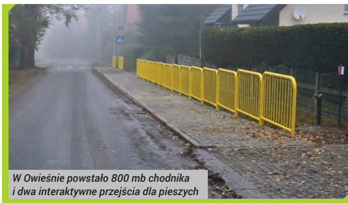
W Owieśnie powstało 800 mb chodnika i dwa interaktywne przejścia dla pieszych

tu dzierżoniowskiego. Kwota dotacji wyniosła 112 210 zł.