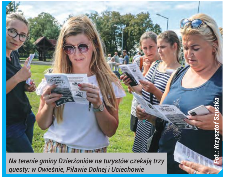
Na terenie gminy Dzierżoniów na turystów czekają trzy questy: w Owieście, Piławie Dolnej i Uciechowie

Więcej informacji na stronie: https://questy.org.pl/ .