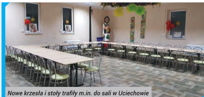
Nowe krzesła i stoły trafiły m.in. do sali w Uciechowie

W ramach projektu pn. „Zakup wyposażenia do sal wiejskich na terenie gminy Dzierżoniów” zakupiono 63 stoły składane, 250 krzesła, 6 zestawów do sali komputerowej składających się z biurka i krzesła, a także 800 sadzonek grabu po-