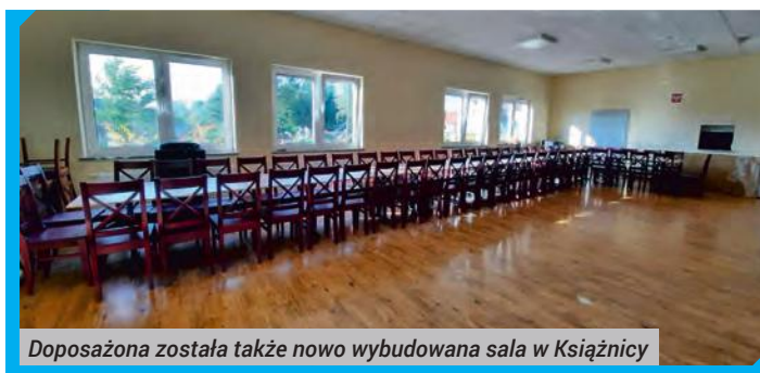
Doposażona została także nowo wybudowana sala w Książnicy

spolitego i 75 kg trawy. Wartość zadania to 55 751,06 zł, z czego 27 875 zł to dofinansowanie z budżetu województwa dolnośląskiego, a 27 876,06 zł - z budżetu gminy Dzierżoniów.