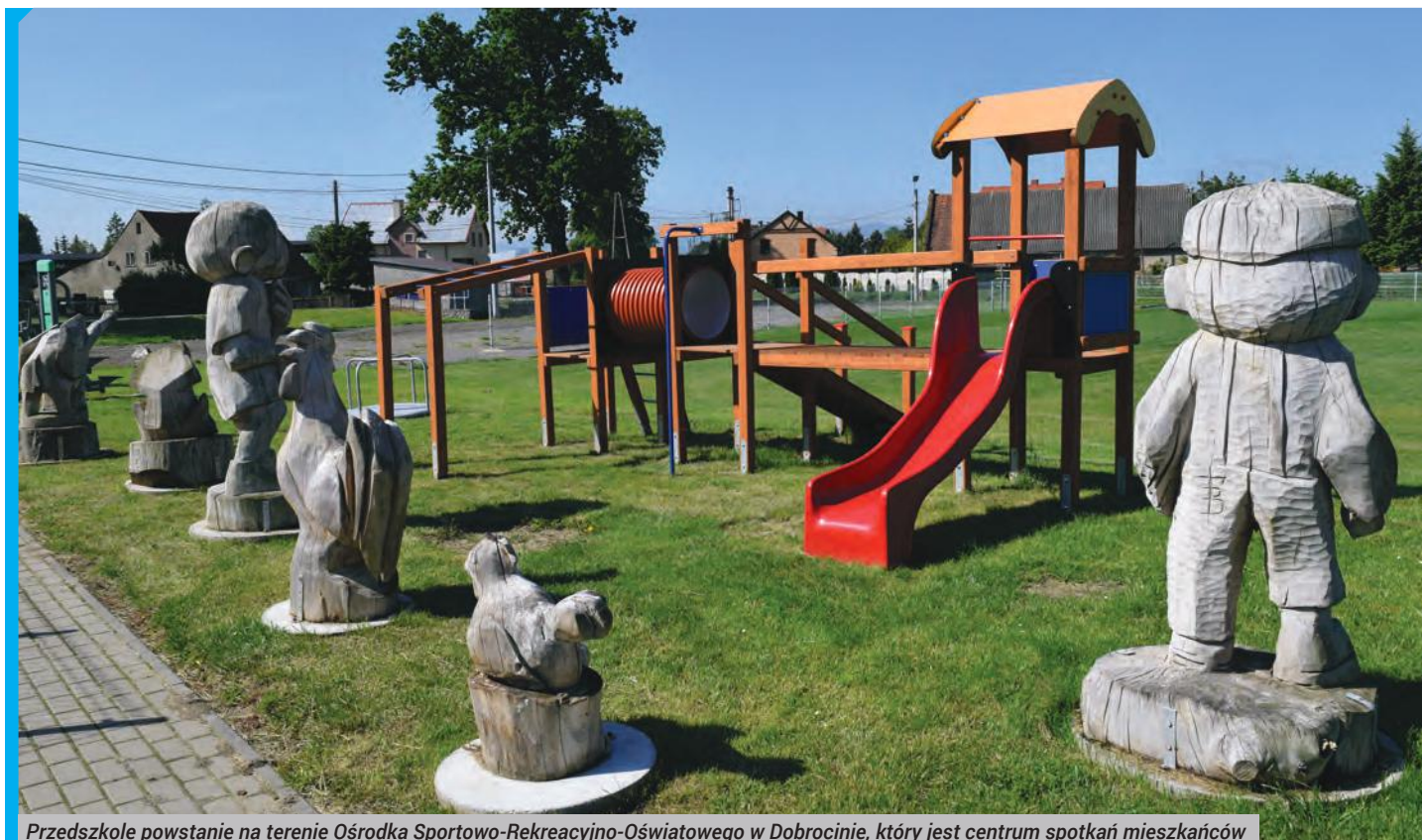
Przedszkole powstanie na terenie Ośrodka Sportowo-Rekreacyjno-Oświatowego w Dobrocinie, który jest centrum spotkań mieszkańców