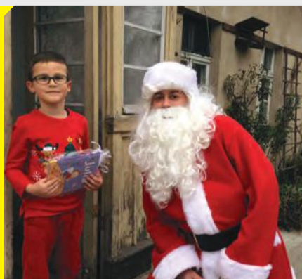
Mikołaj postanowił osobiście podziękować dzieciom za przygotowane przez nie prace