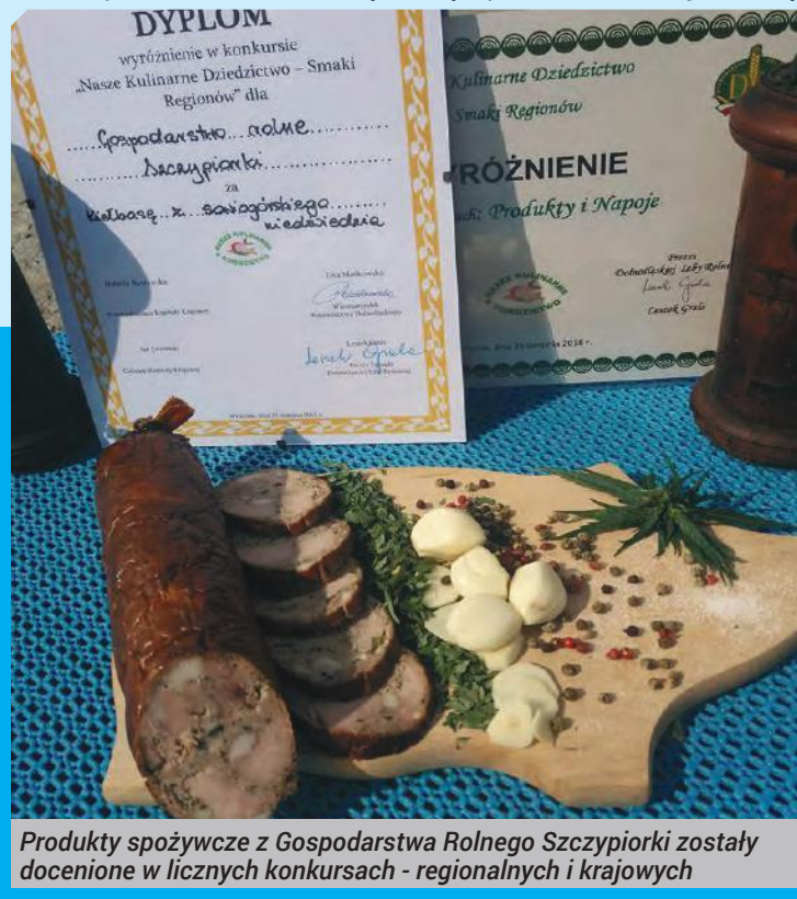
Produkty spożywcze z Gospodarstwa Rolnego Szczypiorki zostały docenione w licznych konkursach - regionalnych i krajowych

Czy w produkcji Waszych słynnych przetworów czerpicie inspiracje z przeszłości? Wykorzystujecie przepisy przekazywane z pokolenia na pokolenie?