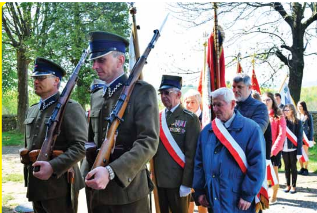
Jak co roku gminne uroczystości uświetnili kombatancki i przedstawiciele SRH „SZPICA”

Uroczystości uświetnili również żołnierze Stowarzyszenia Rekonstrukcji Historycznej „SZPICA”.