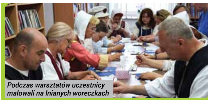
Podczas warsztatów uczestnicy malowali na lnianych woreczkach