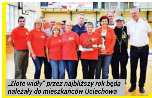
„Złote widły” przez najbliższy rok będą należały do mieszkańców Uciechowa

Dziękujemy również sołtysom, radom sołectkim i mieszkańcom gminy za aktywność, poczucie humoru i wiele pozytywnych emocji. Pragniemy też podziękować wszystkim osobom, które pomogły w organizacji „Zmagaj”, a Młodzieżowej Drużynie Pożarniczej działającej przy OSP Mościsko za przekazanie uczestnikom wartościowej wiedzy na temat udzielania pierwszej pomocy.