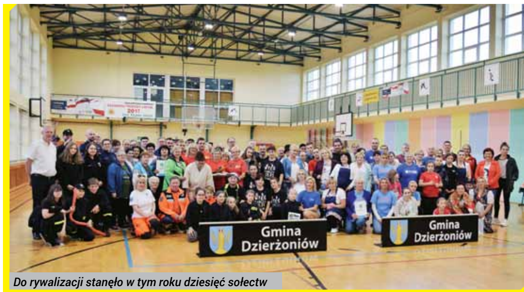
Do rywalizacji stanęło w tym roku dziesięć sołectw