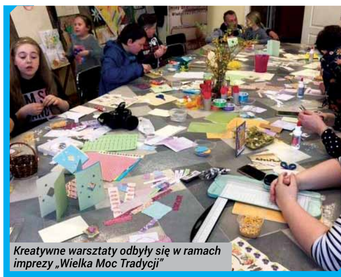
Kreatywne warsztaty odbyły się w ramach imprezy „Wielka Moc Tradycji”