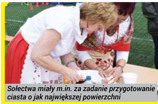
Sołectwa miały m.in. za zadanie przygotowanie ciasta o jak największej powierzchni