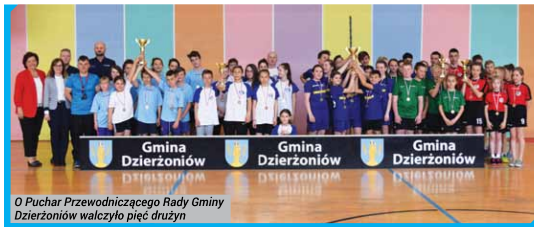
O Puchar Przewodniczącego Rady Gminy Dzierżoniów walczyły pięć drużyn