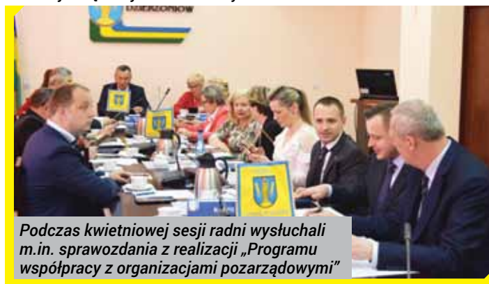
Podczas kwietniowej sesji radni wysłuchali m.in. sprawozdania z realizacji „Programu współpracy z organizacjami pozarządowymi”

w Kielczynie na remont elewacji wieży kościoła parafialnego, przyjęcia „Oceny zasobów pomocy społecznej gminy Dzierżoniów za 2018 rok”, czy ustalenia szczegółowych zasad ponoszenia odpłatności za pobyt w schronisku dla osób bezdomnych.