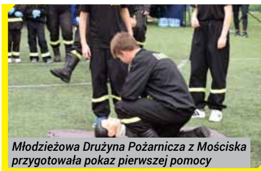
Młodzieżowa Drużyna Pożarnicza z Mościska przygotowała pokaz pierwszej pomocy