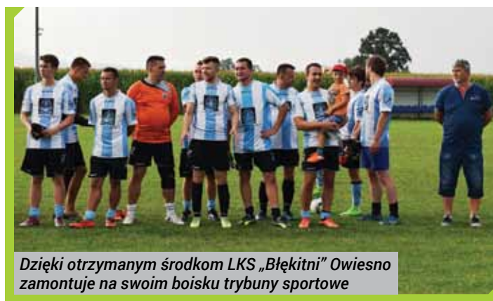
Dzięki otrzymanym środkom LKS „Błękitni” Owiesno zamontuje na swoim boisku trybuny sportowe

Unowocześnienie bazy sportowej z pewnością przyczyni się do stworzenia lepszych warunków zarówno dla trenujących zawodników, jak i kibiców.