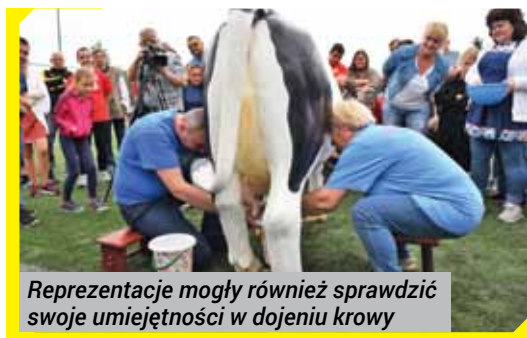
Reprezentacje mogły również sprawdzić swoje umiejętności w dojeniu krowy