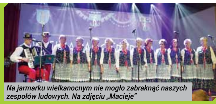
Na jarmarku wielkanocnym nie mogło zabraknąć naszych zespołów ludowych. Na zdjęciu „Macieje”

Biblioteka Publiczna Gminy Dzierżoniów im. Władysława Reymonta