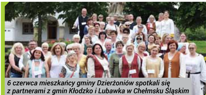
6 czerwca mieszkańcy gminy Dzierżonów spotkali się z partnerami z gmin Kłodzko i Lubawka w Chełmsku Śląskim

Na realizację przedsięwzięcia gmina Dzierżonów pozyskała ponad 51 tys. zł. Wszystkie działania realizowane są z naszymi partnerami: gminą Kłodzko, gminą Lubawka i Biblioteką Publiczną Gminy Dzierżonów im. Władysława Reymonta.