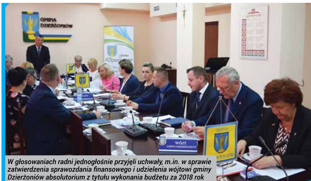
W głosowaniach radni jednogłośnie przyjęli uchwały, m.in. w sprawie zatwierdzenia sprawozdania finansowego i udzielenia wójtowi gminy Dzierżoniów absolutorium z tytułu wykonania budżetu za 2018 rok

Rada w specjalnym oświadczeniu uczciła również trzydziestą rocznicę wyborów parlamentarnych. Radni podkreślili w nim, że wydarzenia sprzed 30 lat utorowały drogę do powstania samorządności w Polsce oraz wyrazili szacunek dla obywateli, którzy swoją postawą walnie przyczynili się do demokratycznych zmian i powstania wolnej Polski.