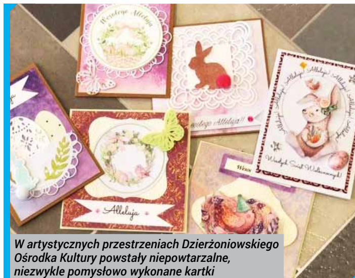
W artystycznych przestrzeniach Dzierżoniowskiego Ośrodka Kultury powstały niepowtarzalne, niezwykle pomysłowo wykonane kartki

Biblioteka Publiczna Gminy Dzierżoniów im. Władysława Reymonta