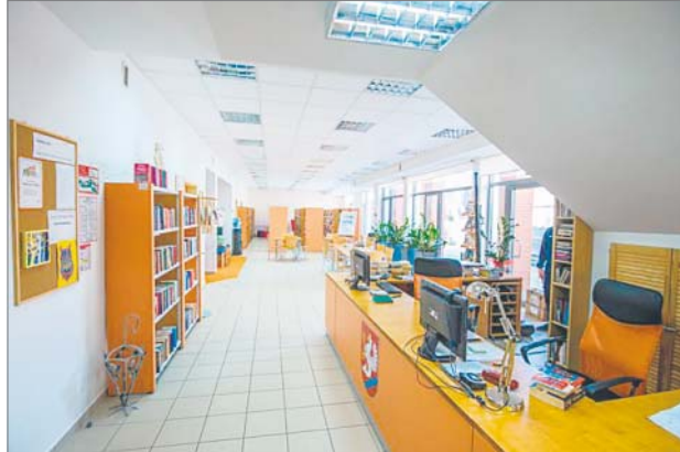
♦ Czytelnicy chwalą nową siedzibę Biblioteki w Sianowie

– W naszych bibliotekach powstają kąciki crossbookin-