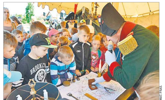
♦ Biblioteka w Świątkach organizuje wiele ciekawych projektów

– Jednym z ostatnich działań tego koła była realizacja projektu „Na Szlaku Napoleońskim – 210. rocznica pobytu