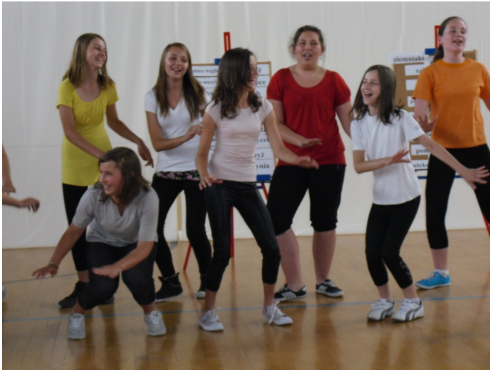
Koło wokalne i ...ruch sceniczny