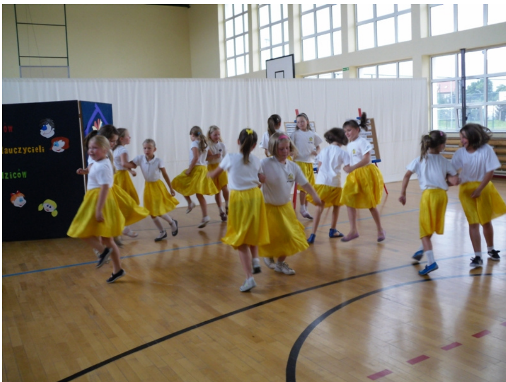
Koło taneczne - taniec irlandzki