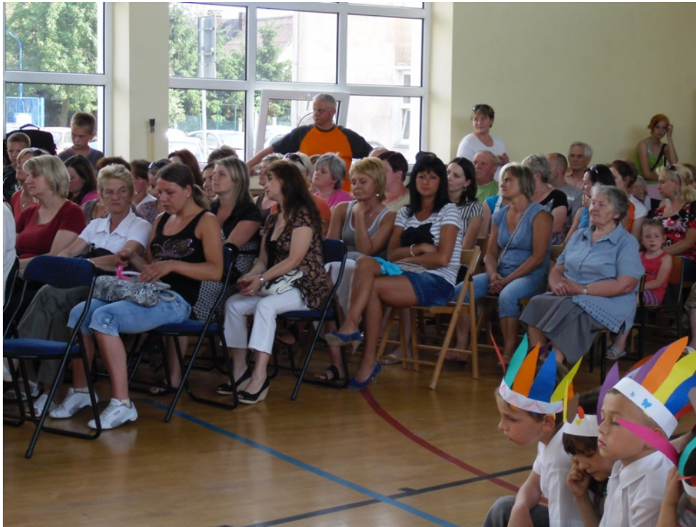
Rodzice, którzy przybyli na podsumowanie projektu